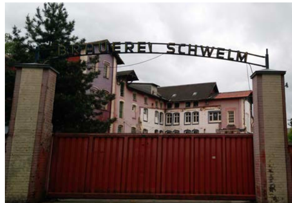
Abbildung 2: Ehemalige Brauerei Schwelm

Das Patrizierhaus wird durch den neuen Eigentümer (Sparkasse) zeitnah zurückgebaut und in ähnlicher Form neu errichtet, da eine Sanierung aufgrund der schlechten Bausubstanz nicht möglich ist. Das Gebäude wird daher zukünftig aus dem Denkmalschutz entlassen werden. Das Kesselhaus hingegen wird erhalten und saniert sowie entsprechend planungsrechtlich abgesichert.