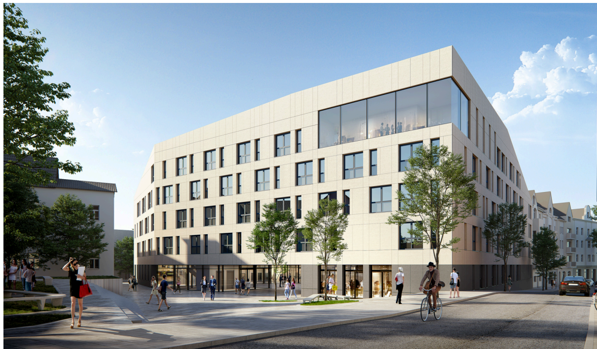
Abbildung 3: Bauvorhaben

Der Eingangsbereich des neuen Rathauses befindet sich an der südlichen Seite des Baukörpers. Hier entsteht ein vorgelagerter Platz, der als repräsentativer Eingangsbereich und ergänzender öffentlicher Raum, mit Anschluss an den östlich angrenzenden Neumarkt, dient.