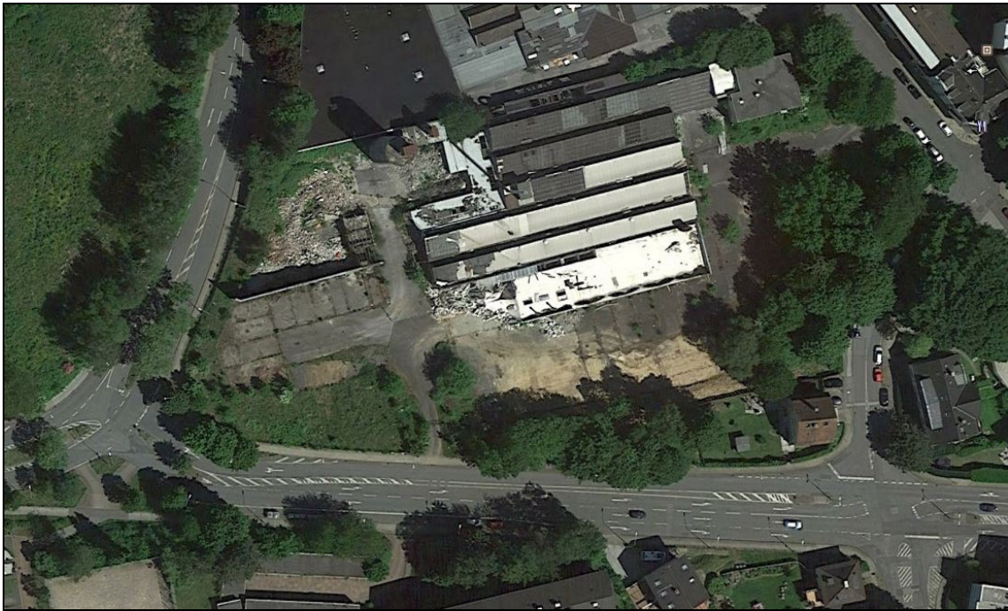
Abb. 2: Luftbild